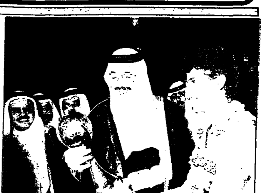
كاس العالم .. بين يدي فيصل بن فهد